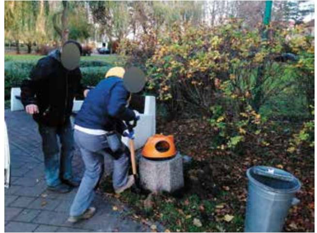
Wymiana koszy betonowych przy ławeczkach na ścieżce wokół jeziora