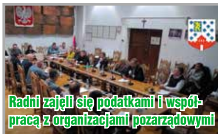
Radni zajęli się podatkami i współpracą z organizacjami pozarządowymi