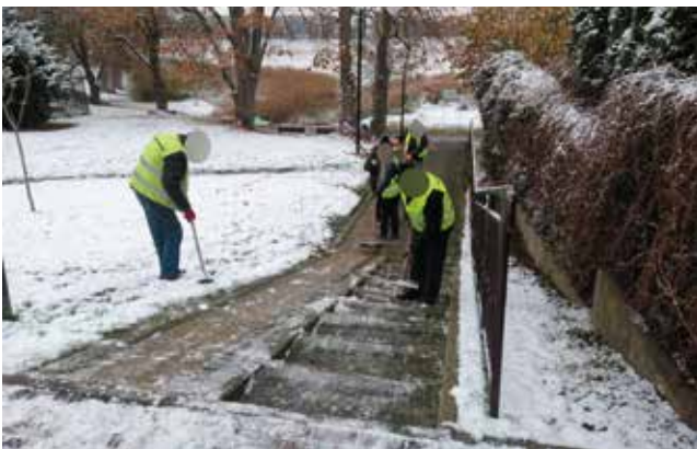
Odśnieżanie schodów - ul. Waryńskiego