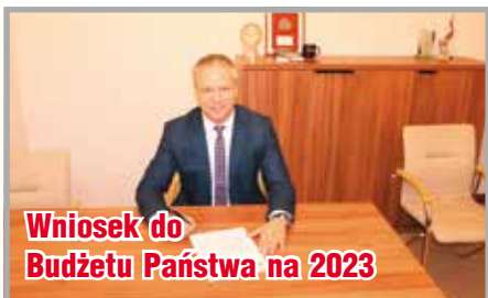
Wniosek do Budżetu Państwa na 2023