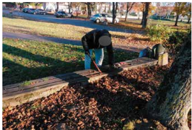
Naprawa ławeczek położonych przy ścieżce pieszo-rowerowej wkoło jeziora