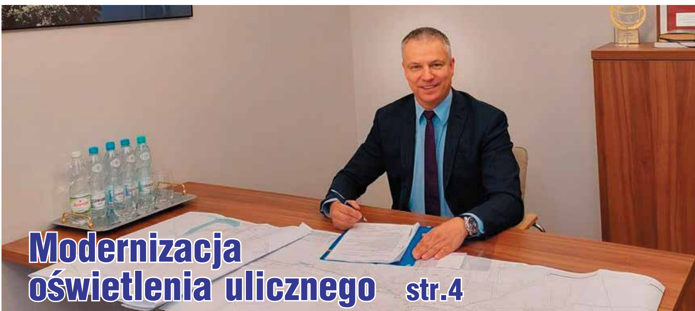
Modernizacja oświetlenia ulicznego str.4