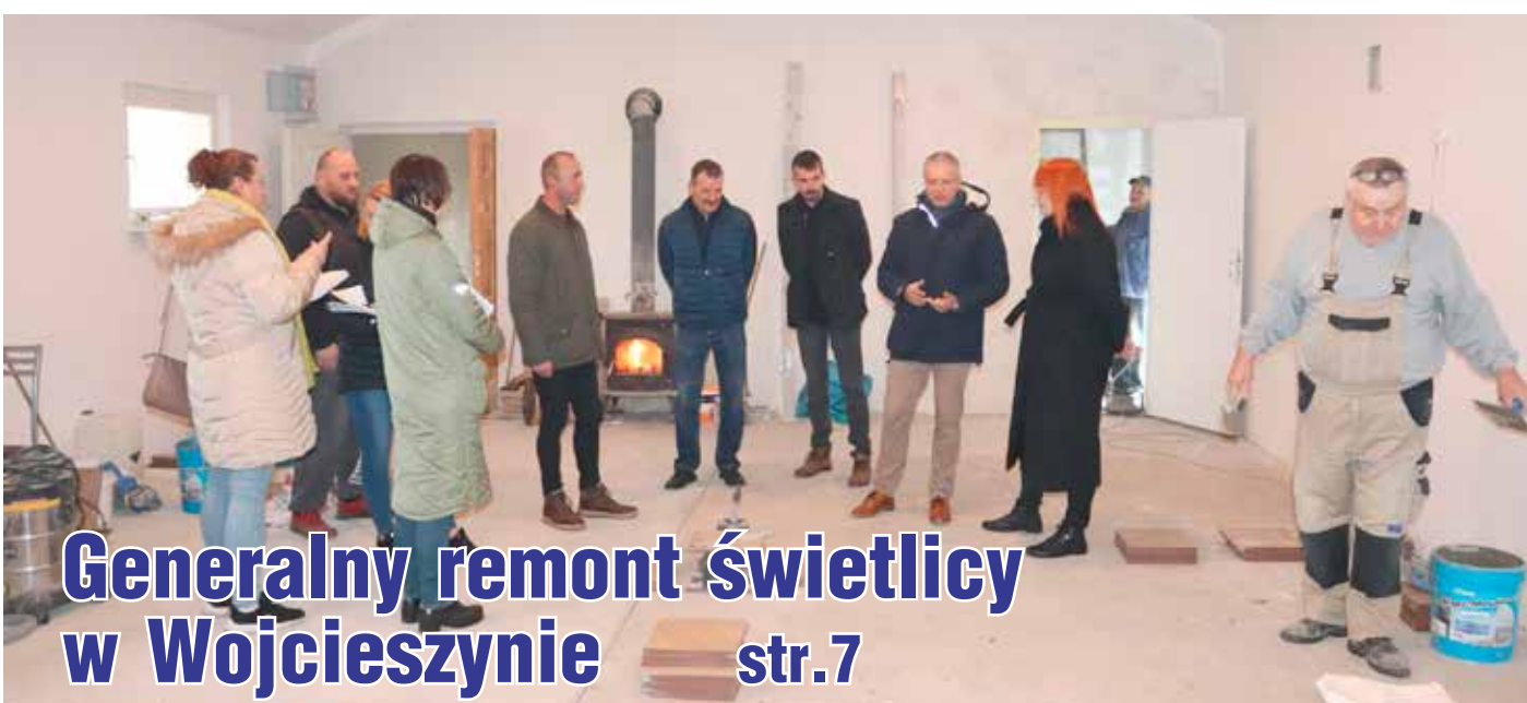
Generalny remont świetlicy w Wojcieszynie str.7