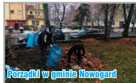
Porządki w gminie Nowogard