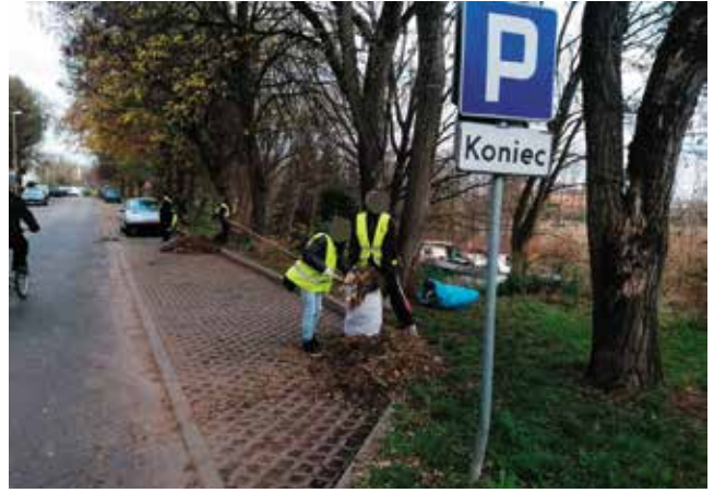
Grabienie liści i sprząkanie parkingów przy ul. 5 Marca